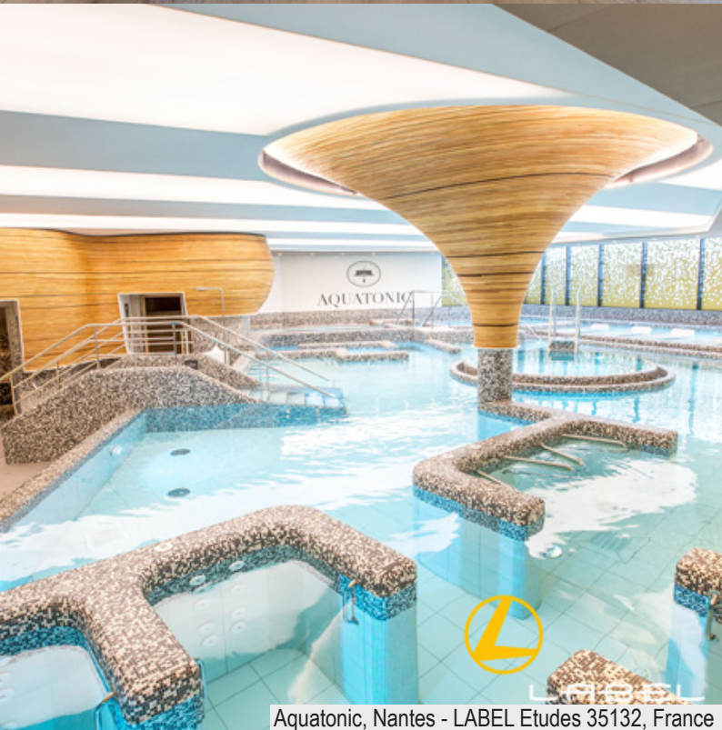
Aquatonic, Nantes - LABEL Etudes 35132, France

A.F. : «Et le BIM dans tout cela : est-ce un gros mot pour un architecte d'intérieur ?»