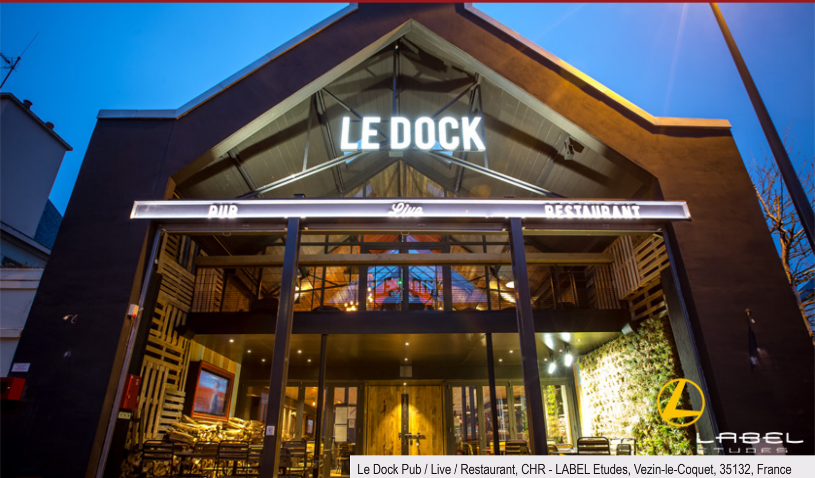
Le Dock Pub / Live / Restaurant, CHR - LABEL Etudes, Vezin-le-Coquet, 35132, France