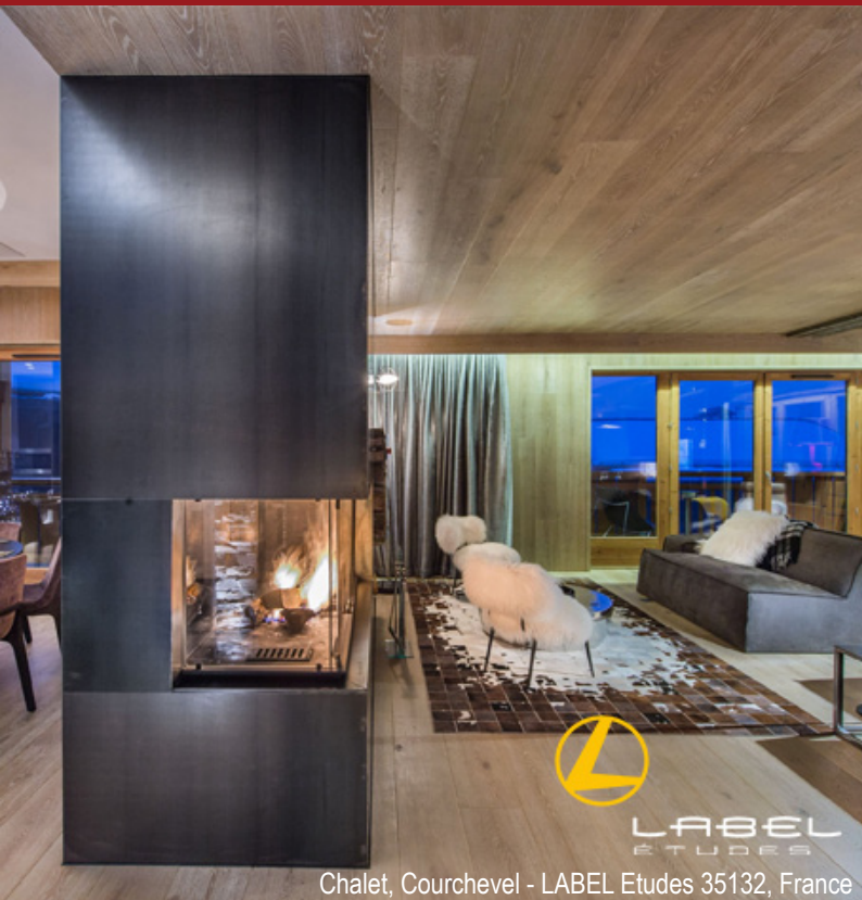
Chalet, Courchevel - LABEL Etudes 35132, France