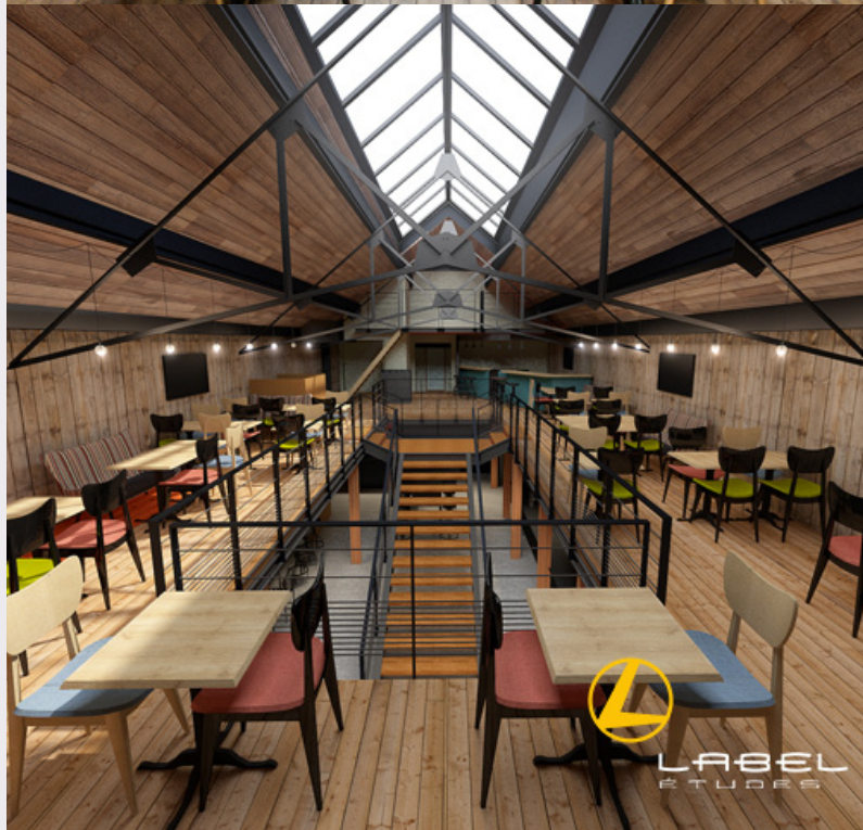
Le Dock Pub / Live / Restaurant, CHR - LABEL Etudes 35132, France Photo du projet et Rendu de son double virtuel